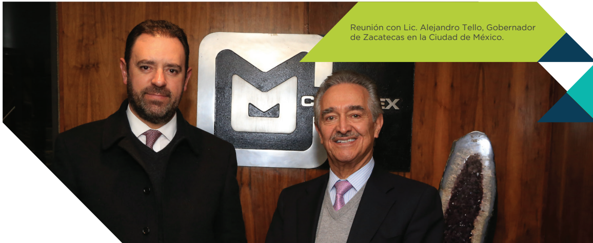
Reunión con Lic. Alejandro Tello, Gobernador de Zacatecas en la Ciudad de México.