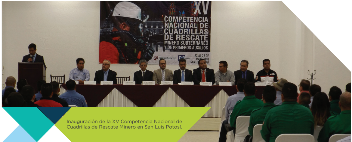
Inauguración de la XV Competencia Nacional de Cuadrillas de Rescate Minero en San Luis Potosí.