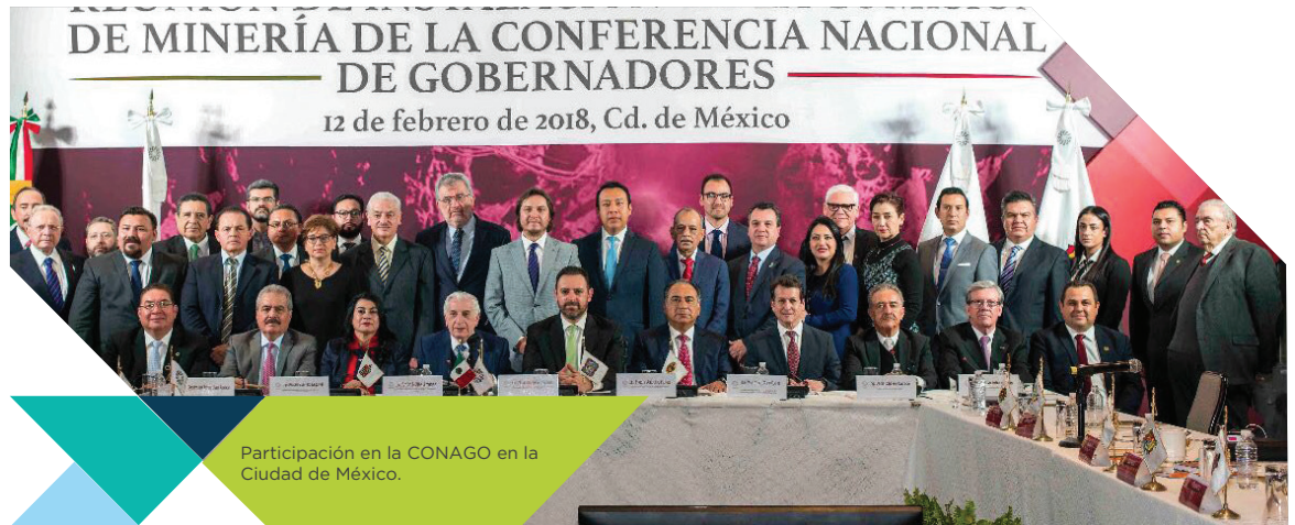
Participación en la CONAGO en la Ciudad de México.