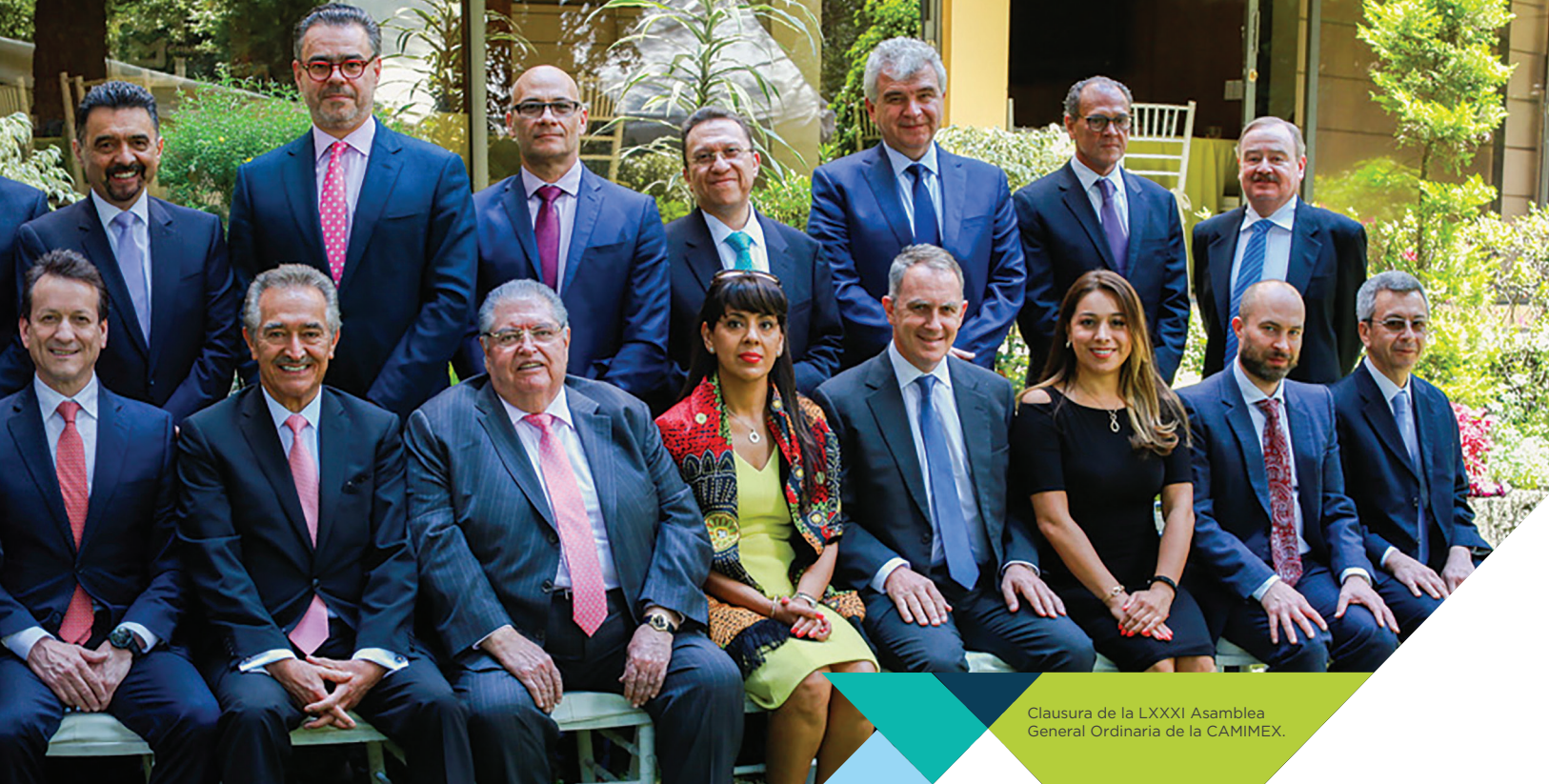
Clausura de la LXXXI Asamblea General Ordinaria de la CAMIMEX.