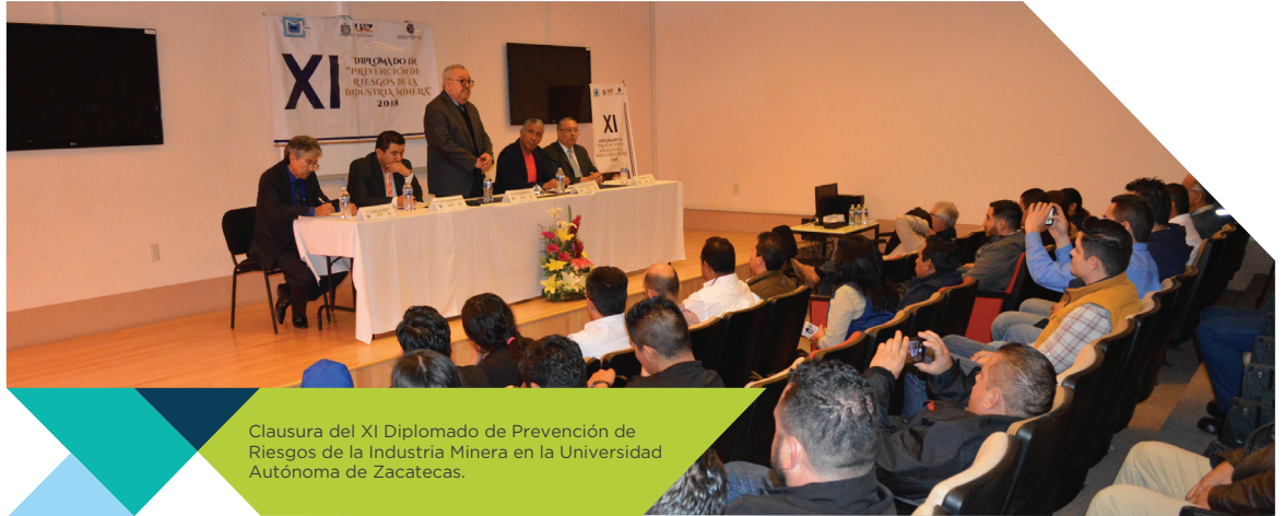
Clausura del XI Diplomado de Prevención de Riesgos de la Industria Minera en la Universidad Autónoma de Zacatecas.