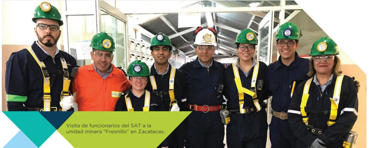
Visita de funcionarios del SAT a la unidad minera "Fresnillo" en Zacatecas.