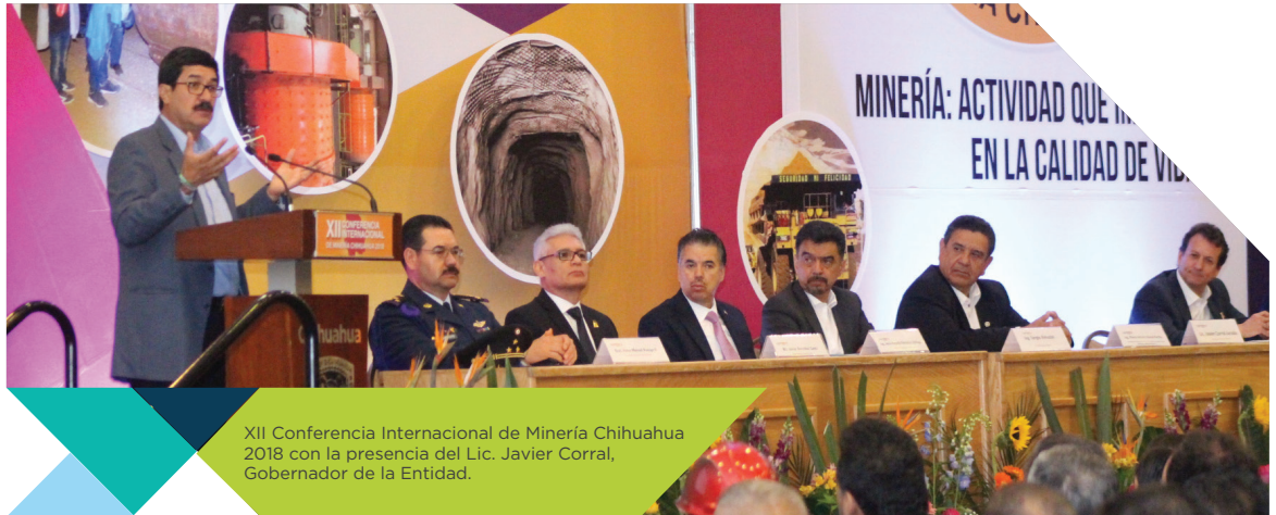
XII Conferencia Internacional de Minería Chihuahua 2018 con la presencia del Lic. Javier Corral, Gobernador de la Entidad.