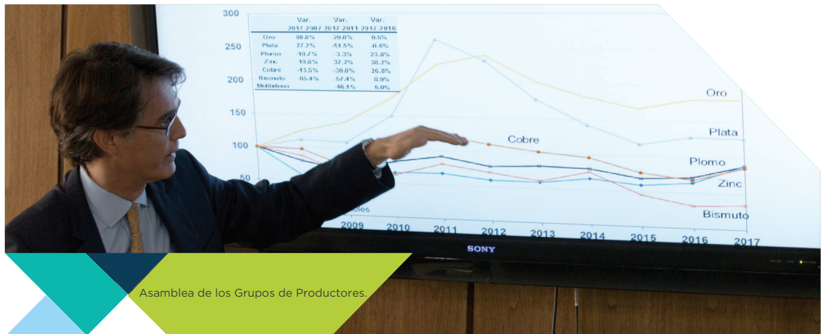
Asamblea de los Grupos de Productores.