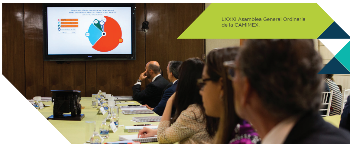
LXXXI Asamblea General Ordinaria de la CAMIMEX.