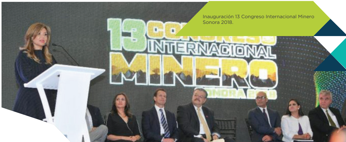
Inauguración 13 Congreso Internacional Minero Sonora 2018.