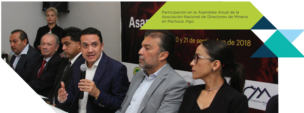
Participación en la Asamblea Anual de la Asociación Nacional de Directores de Minería en Pachuca, Hgo.