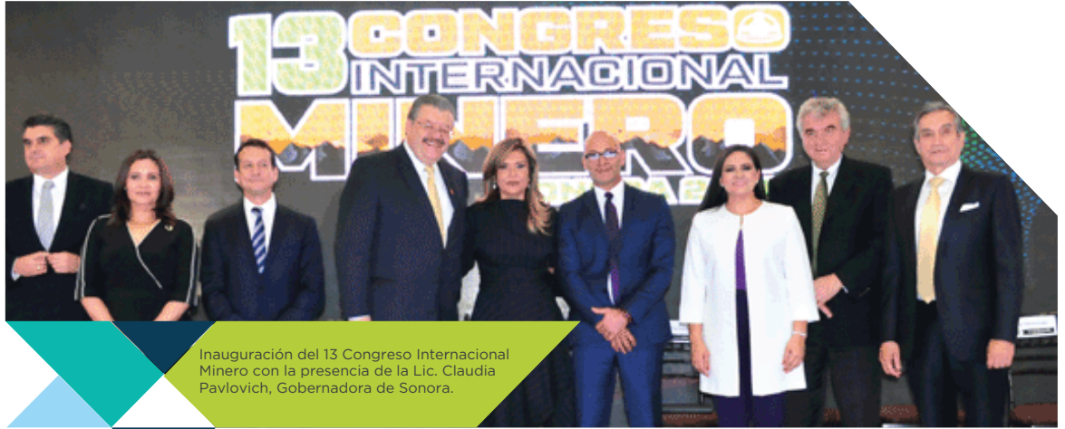
Inauguración del 13 Congreso Internacional Minero con la presencia de la Lic. Claudia Pavlovich, Gobernadora de Sonora.