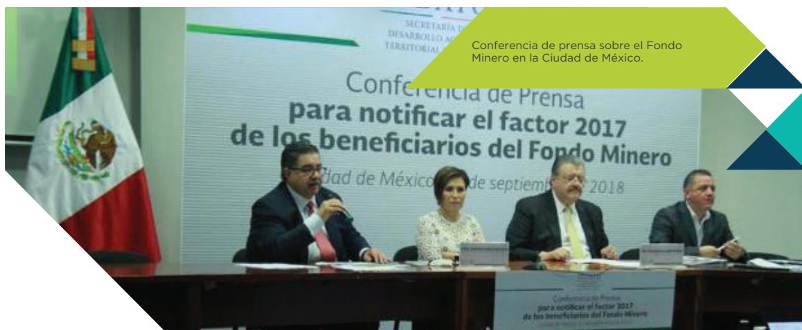
Conferencia de prensa sobre el Fondo Minero en la Ciudad de México.