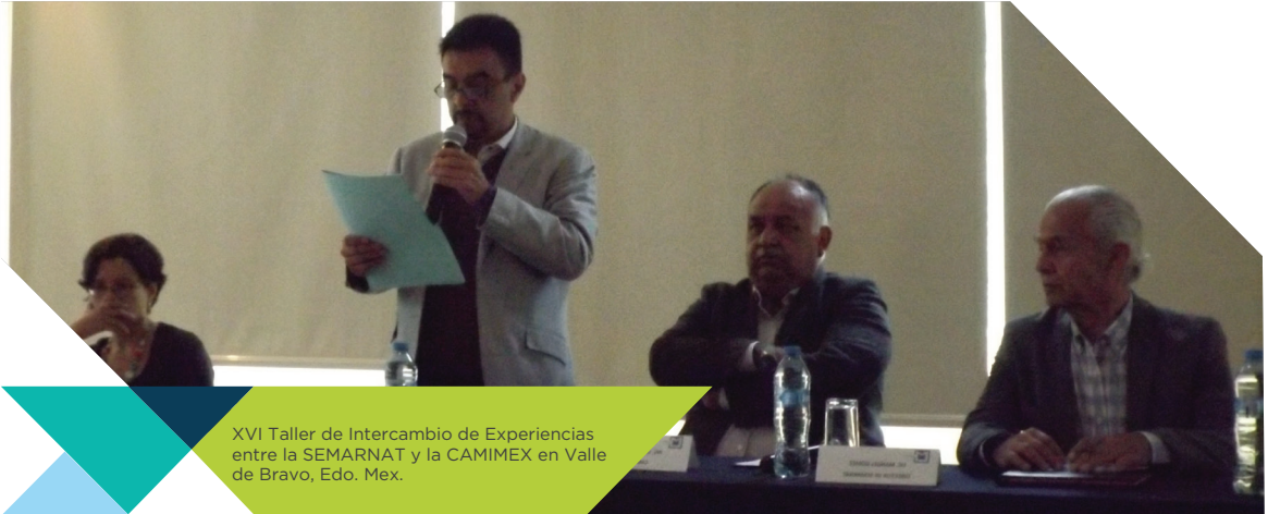
XVI Taller de Intercambio de Experiencias entre la SEMARNAT y la CAMIMEX en Valle de Bravo, Edo. Mex.